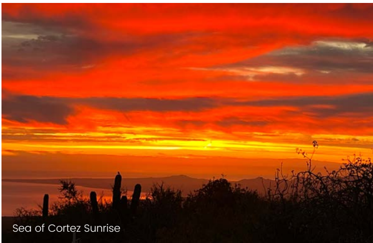
Sea of Cortez Sunrise