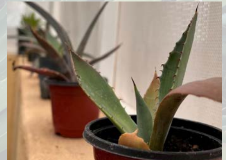
Fotos: Elizabeth Valdovinos/Cuenca; Gráfico: Bat Conservation International; Foto de fondo: Bill Steen