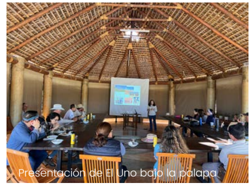
Presentación de El Uno bajo la palapa