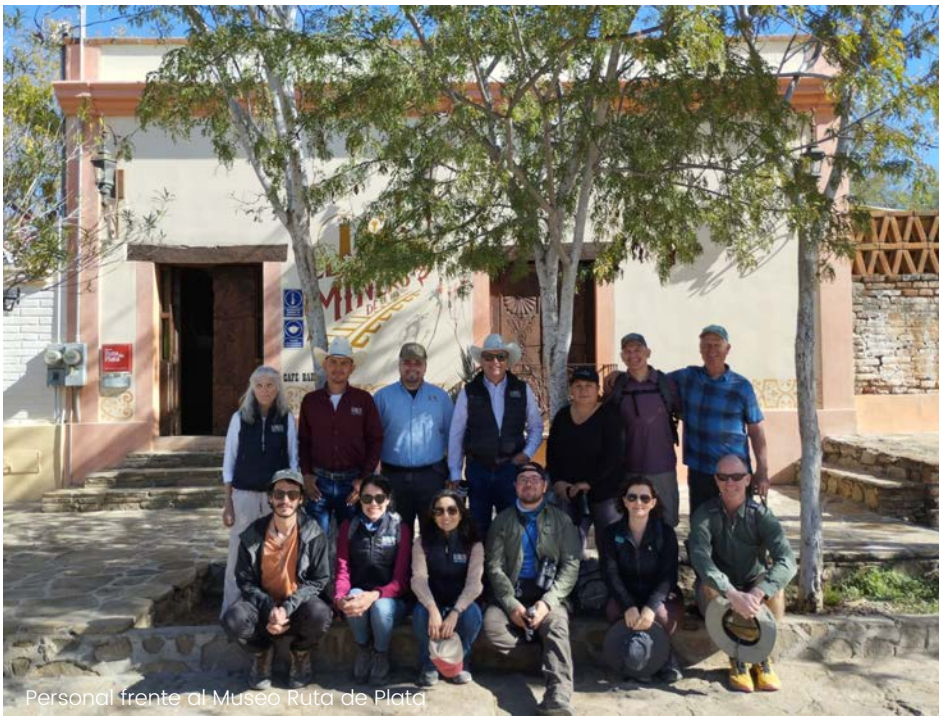
Personal frente al Museo Ruta de Plata