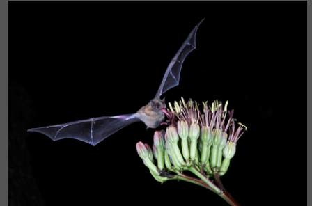
Un murciélago polinizando un agave