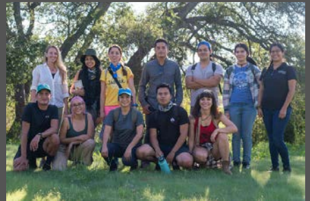
Escuela de Campo de Sonora