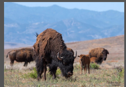
Rancho El Uno