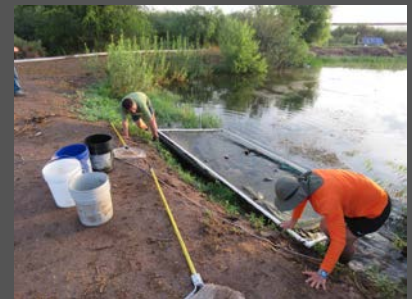
Investigación del bagre yaqui